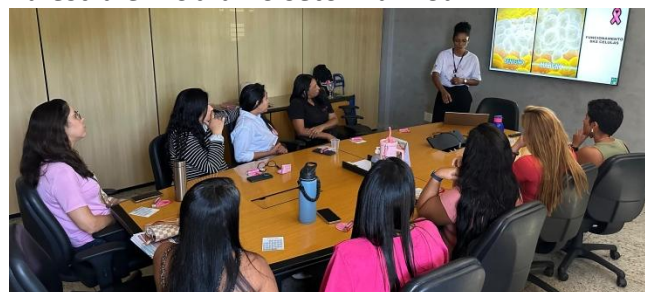
Palestra em empresa no SIA