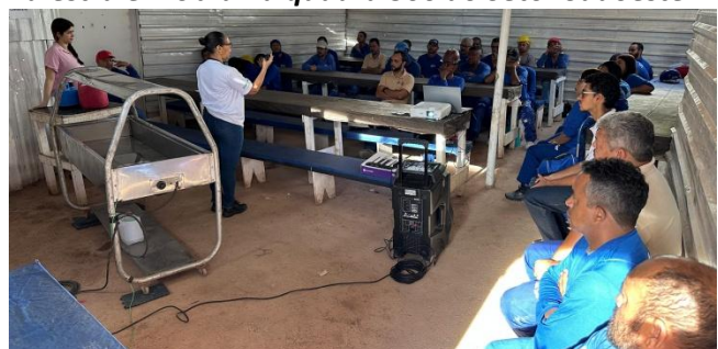
Palestra em obra em Águas Claras