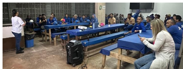
Palestra em obra no setor Park Sul

A Campanha do OUTUBRO ROSA , que prevê uma série de ações de prevenção do câncer de mama e de defesa da saúde da mulher, contou com a realização de várias palestras na última semana. A campanha é coordenada pelo SECONCI-DF e tem apoio do STICOMBE Brasília e do SINDUSCON-DF. O Sindicato participou de todas as palestras e sorteu camisetas com a marca Mulheres que Constroem às presentes (ver fotos).