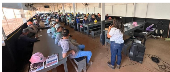
Palestra em obra na quadra 500 do Setor Sudoeste

dia 10 de outubro. A ação aconteceu no Centro de Ensino Médio de Taguatinga ( foto acima ) e levou esclarecimentos sobre a importância da segurança, saúde e prevenção de acidentes de trabalho. O objetivo é formar uma geração mais atenta aos cuidados com a vida no ambiente de trabalho. O evento é promovido pela Câmara Brasileira da Indústria da Construção (CBIC).